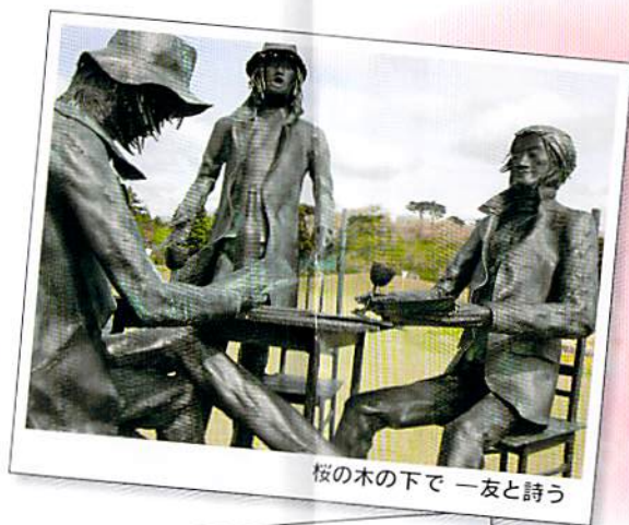
桜の木の下で 一友と詩う