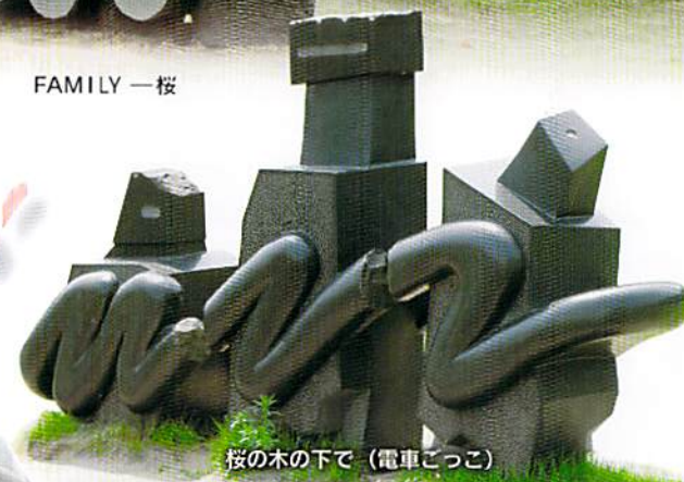
桜の木の下で (電車ごっこ)